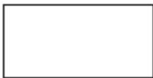
Ubicación del operador de software. relativo al sitio.