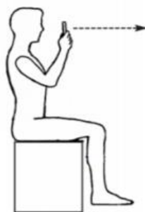
La ubicación del operador.